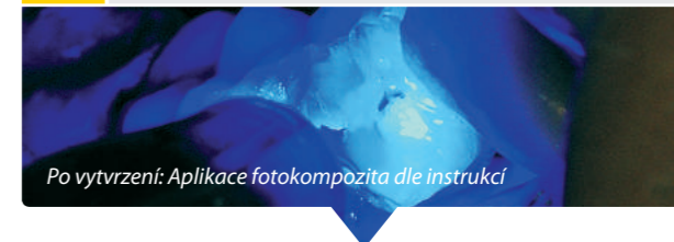
Po vytvrzení: Aplikace fotokompozita dle instrukcí