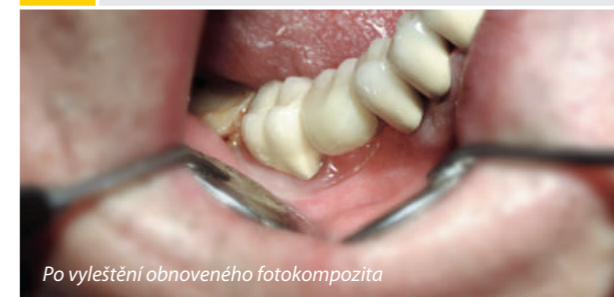
Po vyleštění obnoveného fotokompozita

Poznámka: Toto není návod k použití. Dodržujte pokyny v návodu dodávaném s tímto materiálem. Odpovědnost za zákrok zůstává na ošetřujícím zubním lékaři.