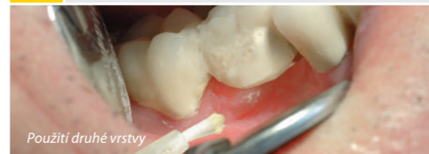
Použití druhé vrstvy