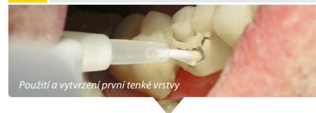
Použití a vytvrzení první tenké vrstvy