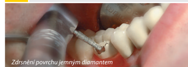
Zdrsnění povrchu jemným diamantem