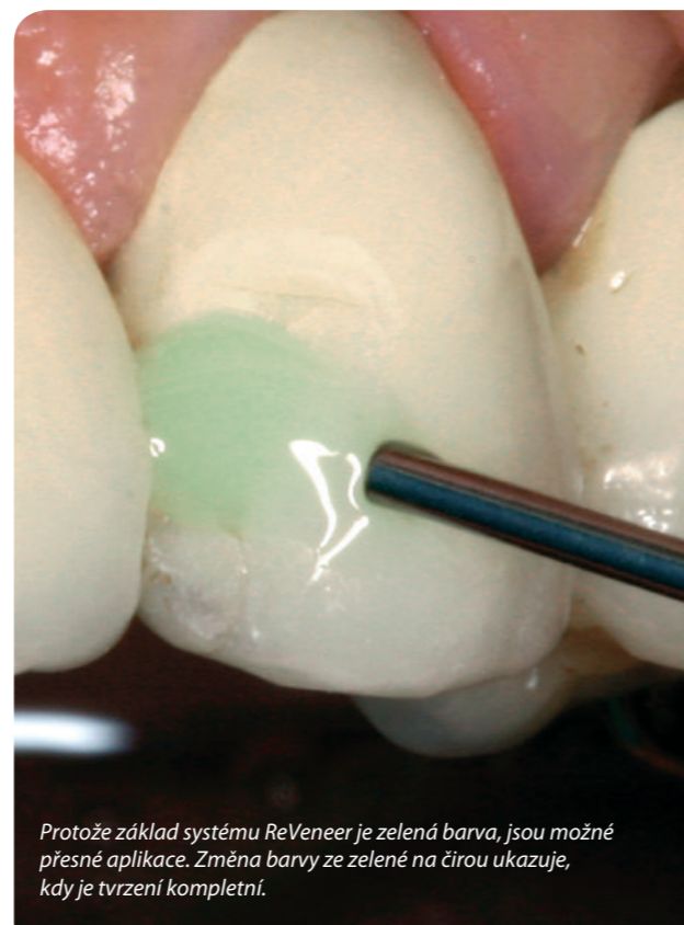
Protože základ systému ReVeneer je zelená barva, jsou možné přesné aplikace. Změna barvy ze zelené na čirou ukazuje, kdy je tvrdění kompletní.

„Zelená barva základní pasty se ukázala jako velmi pozitivní, neboť poskytuje příjemný kontrast proti keramice, a tak usnadňuje přesnou práci“