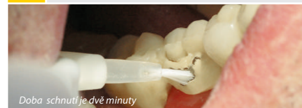
Doba schnutí je dvě minuty